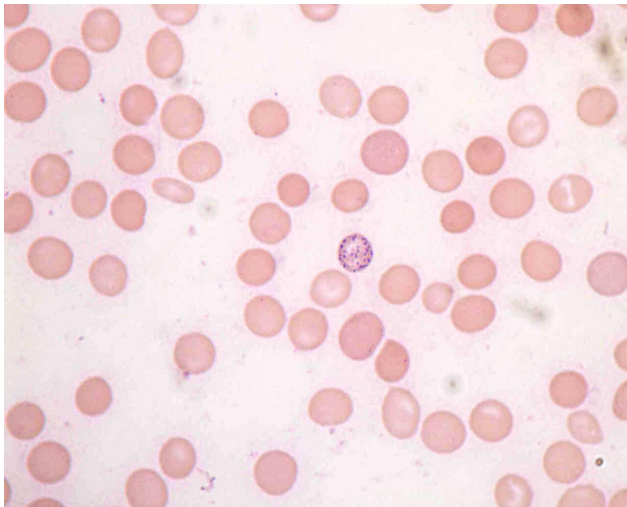
Figura 1. Extensión de sangre periférica en la que se aprecia un hematíe con punteado basófilo

dolores abdominales y lumbares (antecedentes de patología vertebral) y vómitos. Tres años antes ya había padecido un episodio de anemia que fue etiquetada de refractaria simple con resolución espontánea en varios meses. Descartada patología abdominal en urgencias, es transfundida y se cita en consultas para estudio. Acude otra vez a urgencias e ingresa en UCI por encefalopatía coincidiendo con la ingesta de somníferos en dosis no tóxicas. En el estudio de anemia se detecta punteado basófilo en los hematíes (figura 1) y signos de diseritropoyesis en médula ósea sin criterios de anemia refractaria. Al observar punteado basófilo se solicita la cuantificación de plomo en sangre, resultando ser de 1050 \mu\text{g L}^{-1} .