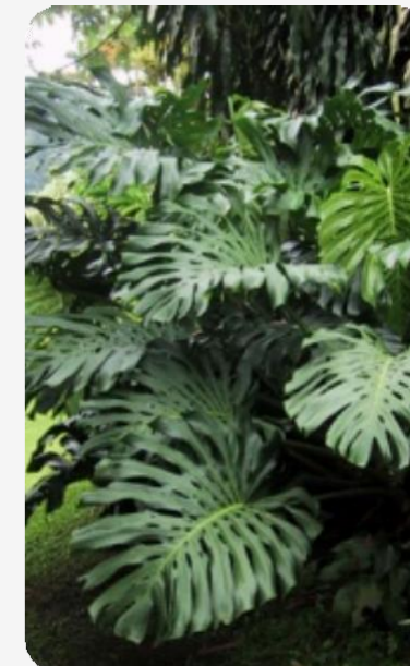
Monstera (Costilla de Adán)