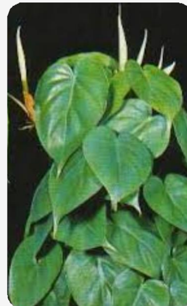
Colocasia (Oreja de Elefante)