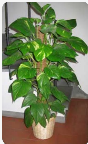
Epipremnum aureum (Potus)